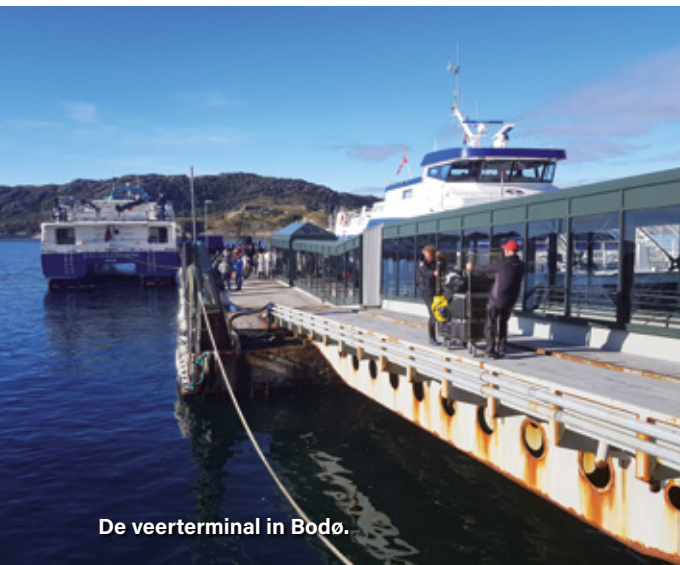
De veerterminal in Bodø.