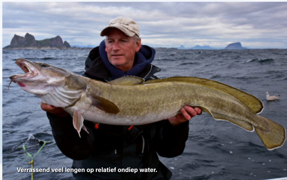
Verrassend veel lengen op relatief ondiep water.

gen, maar toch mooie vissen van over de meter lang. Opvallend is ook dat wij, op een paar verdwaalde vissen na dan, vrijwel nergens concentraties met grotere kabeljauwen en dikke koolvissen tegenkomen. En die worden hier wel degelijk gevangen! Ook niet op dieper water aan de randen van de ondieptes en verder op open zee. Wij zijn niet de enige, want ook de beroepsvissers kunnen ze niet vinden, zo krijgen we later te horen. Een geluk bij een ongeluk, de weersvoorspelling naar het einde toe wordt steeds beter en ieder heeft al een paar heilbotten gevangen, maar het zijn voornamelijk kleinere vissen. Omdat de windvoorspelling gunstig is, besluiten we de laatste twee dagen naar het zuiden te gaan. Een heel interessant