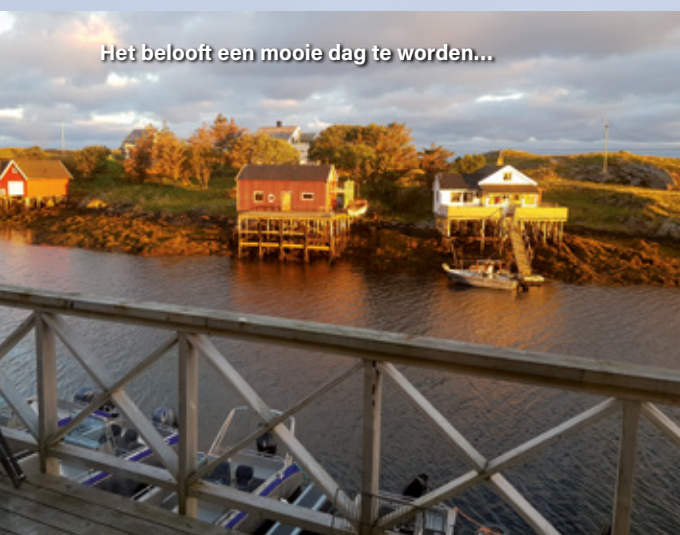
Het belooft een mooie dag te worden...