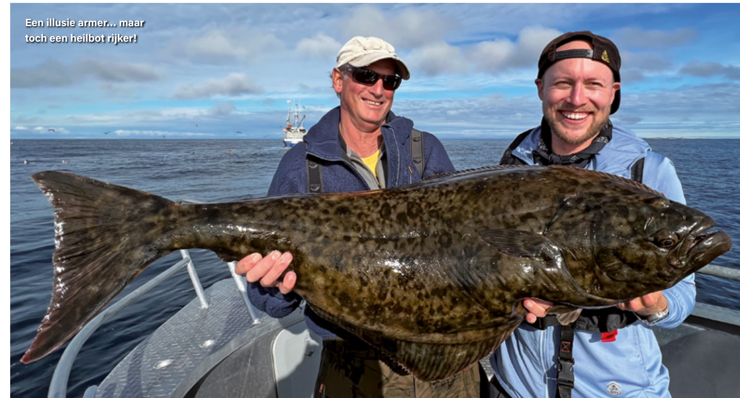
Een illusie armer... maar toch een heilbot rijker!

te winnen. Na een uur zijn we nog geen steek verder, wat moet dit zijn? Nog een half uur later, na eindelijk weer 10-20 meter te hebben gewonnen en we rond de 70 meter zitten, komen de anderen even kijken. Is het geen net wordt er gevraagd? Ik vertel ze dat we de vis op zo'n 45 meter diep gehaakt hebben en al richting de 90 meter op sleeptouw zijn genomen... De twijfel begint wel toe te nemen, want beweging