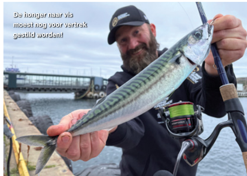
De honger naar vis moest nog voor vertrek gestild worden!