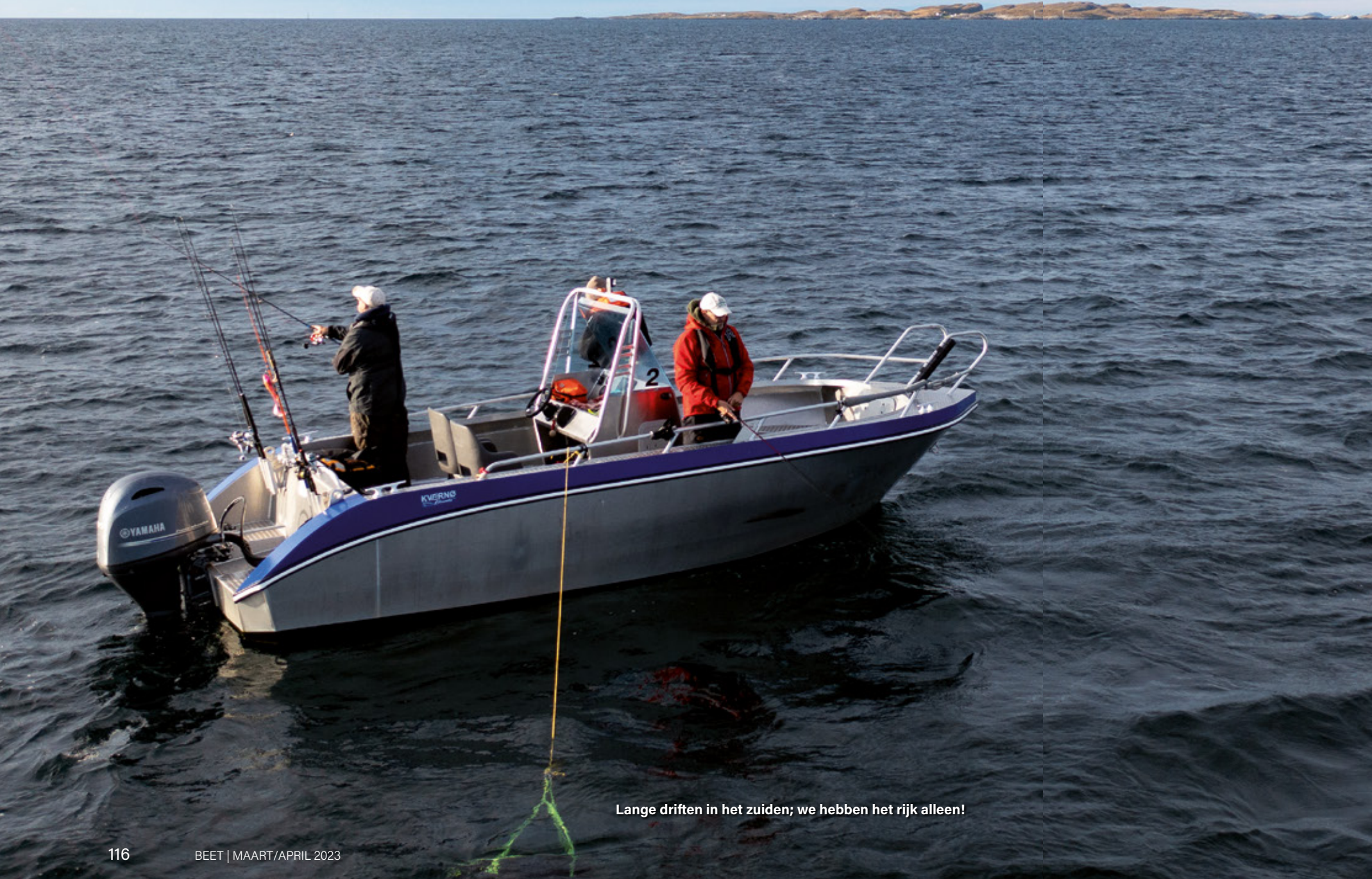
Lange driften in het zuiden; we hebben het rijk alleen!