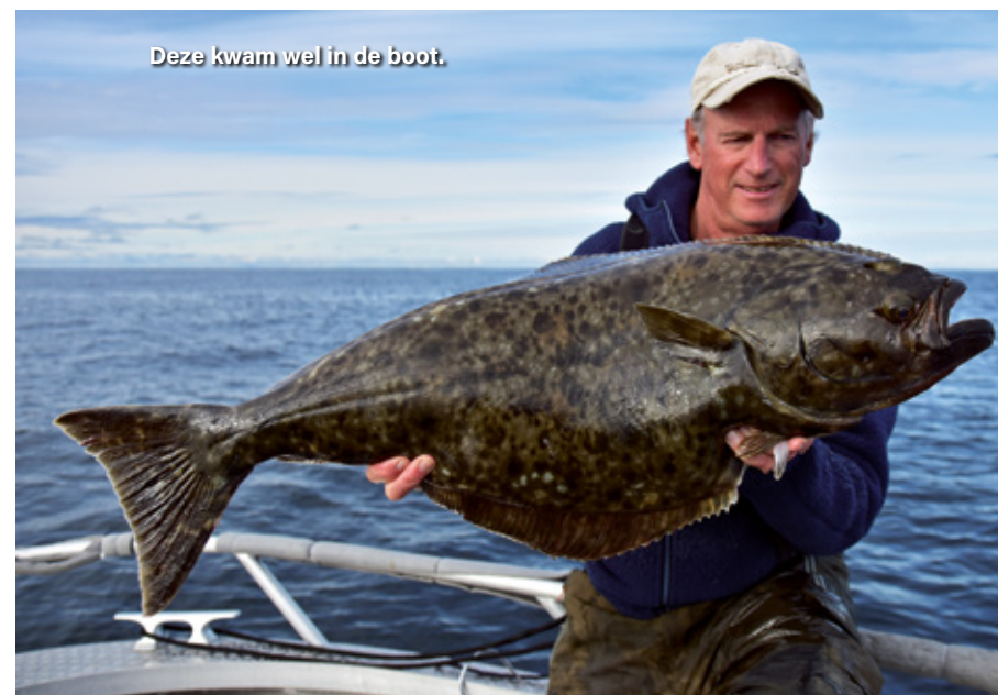
Deze kwam wel in de boot.