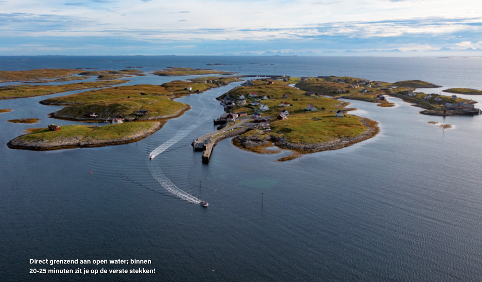
Direct grenzend aan open water; binnen 20-25 minuten zit je op de verste stekken!

de meeste actie aan de noordoostpunt op een iets diepere plaat van zo'n 50 meter, grenzend aan diep water, waar we mooie lange driften kunnen maken. De meeste aanbeten komen op de aasvissen. Wel maken we nog een hectisch uurtje mee als we tegen het einde van de dag een klein, ondiep plaatje naast een eilandje afdriften en kort achter elkaar meerder aanbeten krijgen van (meest kleine) heilbotten op onze