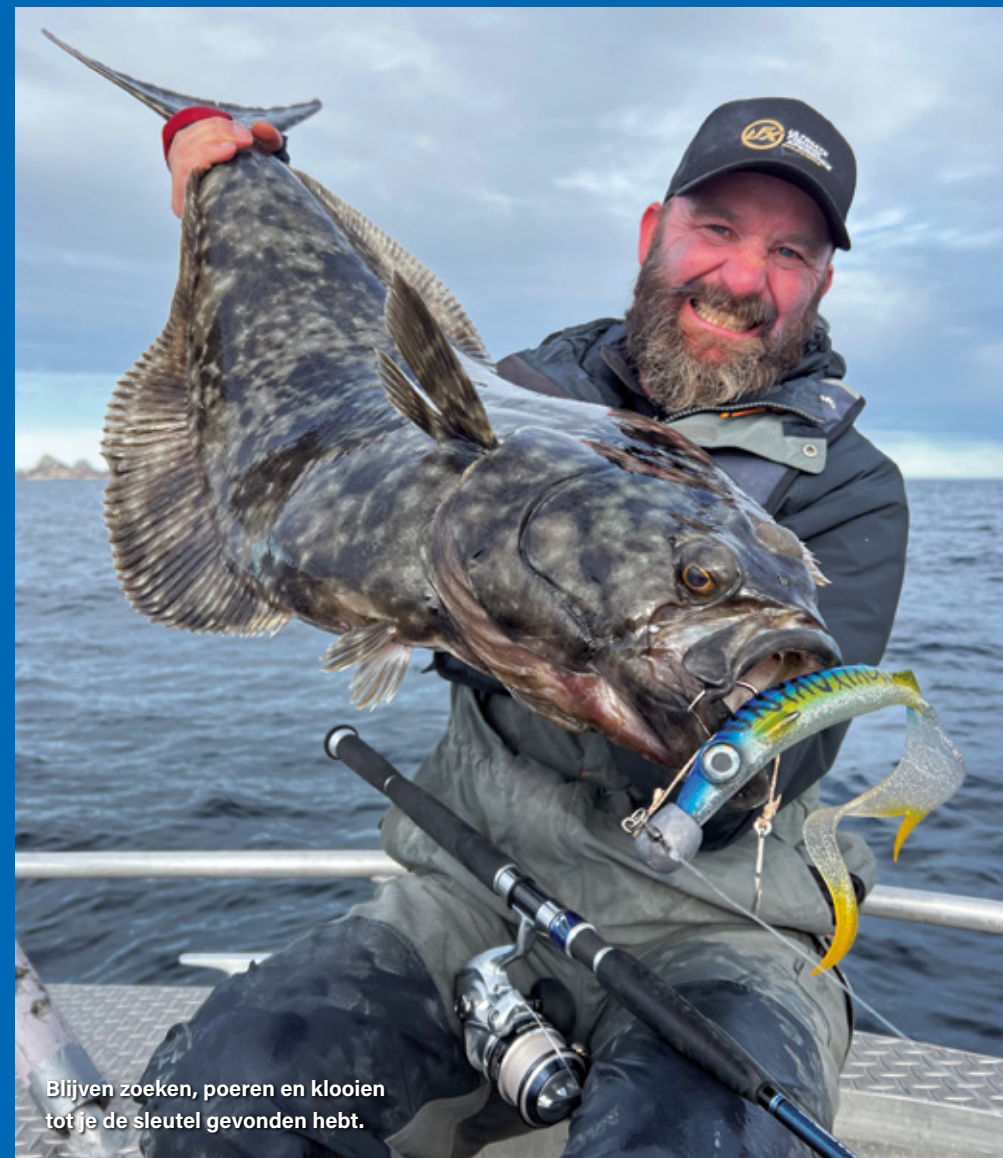
Blijven zoeken, poeren en klooiën tot je de sleutel gevonden hebt.

Als ik alle grote, dikke baits links laat liggen, blijft er een schamel hoopje kleinere en slankere softbaits over. Maar wel een hoopje waar ik alle vertrouwen in heb: The Boss shads, een paar Shocktails (beide van Spro) en een zootje Sandeels van Savage Gear. Zodra de stroming en wind het toelaten, verruil ik de 4-oz koppen voor 3-oz om het aas zo traag mogelijk vlak boven de bodem binnen te kunnen vissen. Niet lang na deze tactische wissel komen de eerste heilbotjes tot ca 10 kilo aan boord. Maarten doet goede zaken met de 18 cm Svartzonker McPike (superzachte bait met heftige staartactie) en mijn favoriet voor deze trip is de Spro Shocktail met makreelprint. Ik weet niet waarom, maar een aanbeet van een heilbot op zo'n typisch snoekaasje geeft gewoon een extra kick. Maar ik ben er nog niet, want elke dag wordt er wel een staart afgebeten zonder dat de vis blijft hangen. Een stinger blijkt de finishing touch: de dagen daarna vang ik nog een aantal mooie vissen op deze hulphaak. Het venijn zat uiteindelijk letterlijk in de staart.