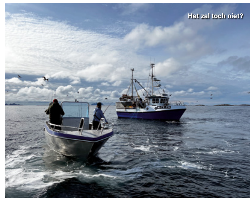
Het zal toch niet?