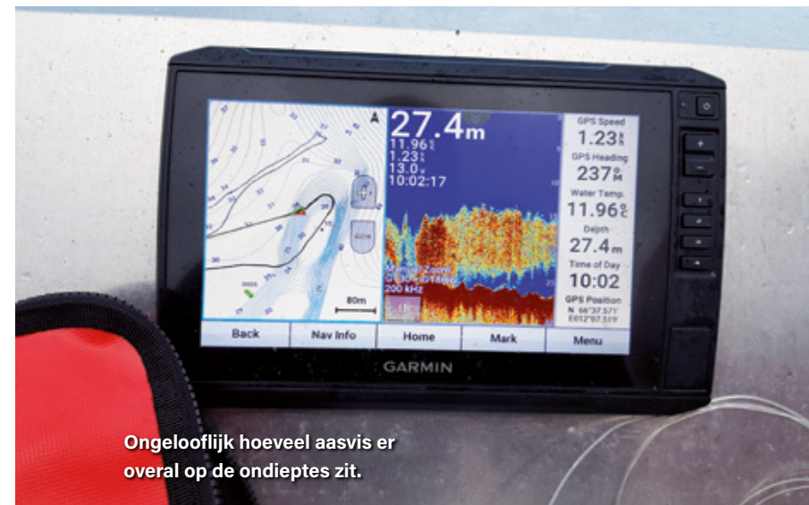
Ongelooflijk hoeveel aasvis er overal op de ondieptes zit.