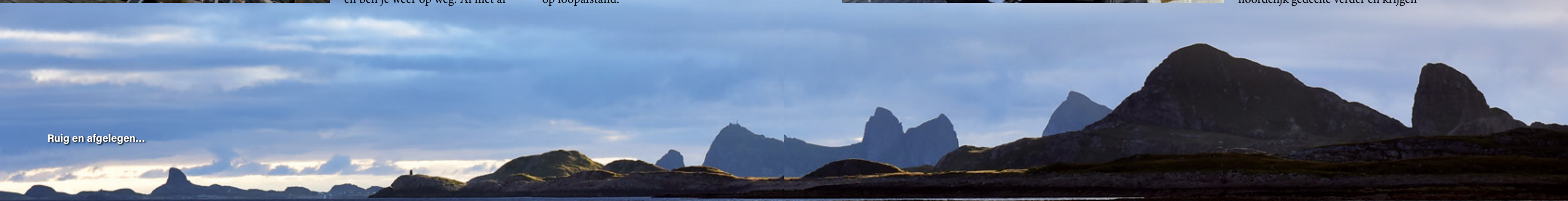
Ruig en afgelegen...